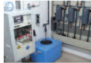
Installazione analizzatore COD multistream

non è più necessaria. La misura del COD può essere realizzata anche in presenza di alto carico salino (>=20 g/L), ed è anche multi-streams grazie ai sistemi di campionamento e gestione via PLC forniti “chiavi in mano” da TECNOVA HT.